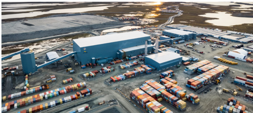
Mine Meliadine d'Agnico Eagle

La Monnaie royale canadienne détient la certification « bonne livraison » de la LBMA, car elle adhère à un ensemble d'obligations et de normes encadrant l'approvisionnement en métaux précieux auprès de fournisseurs et de clients.