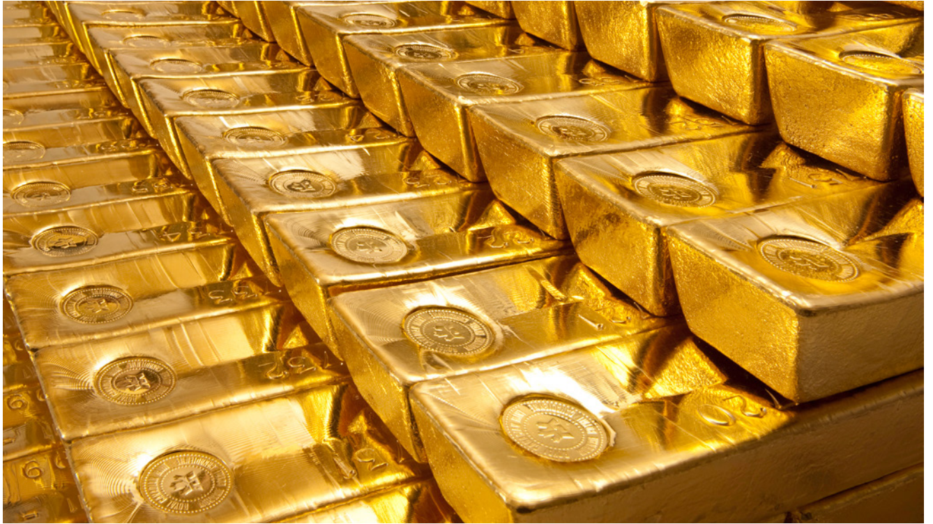
Lingots certifiés « bonne livraison » de Londres