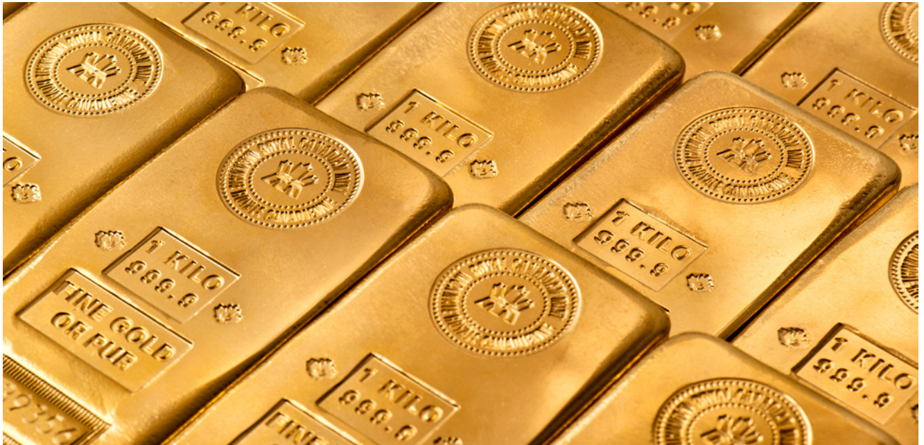
Lingots de 1 kilo en or de la Monnaie royale canadienne