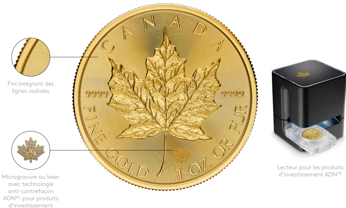
Fini intégrant des lignes radiales