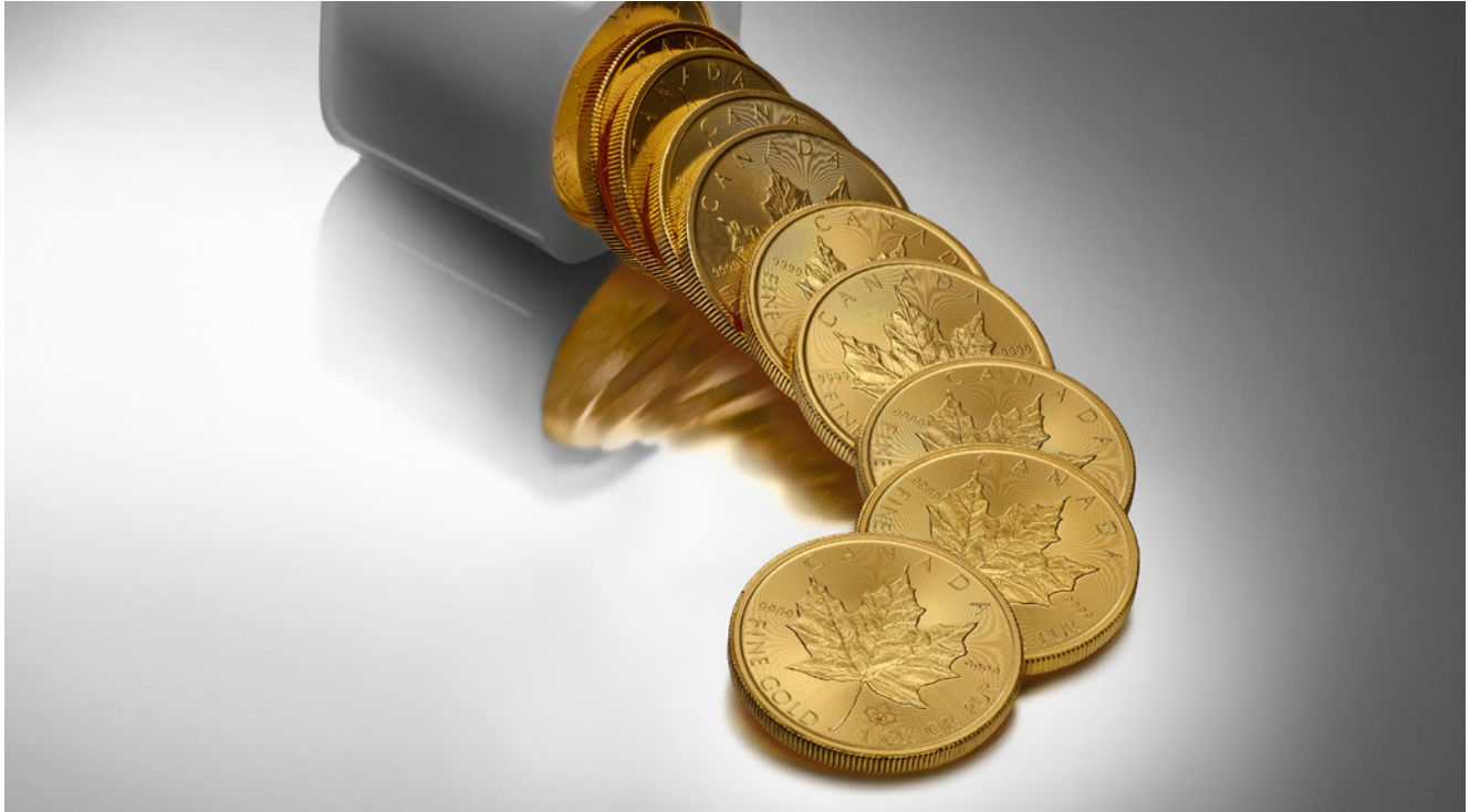
Pièces d'investissement Feuille d'érable en or (FEO)