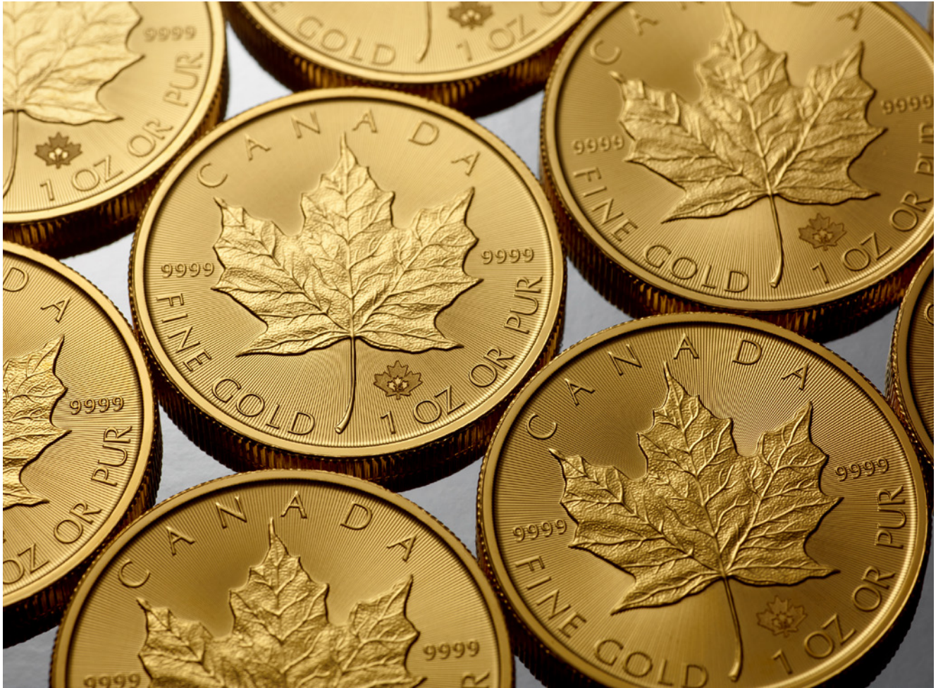
Pièces d'investissement Feuille d'érable en or (FÉO)