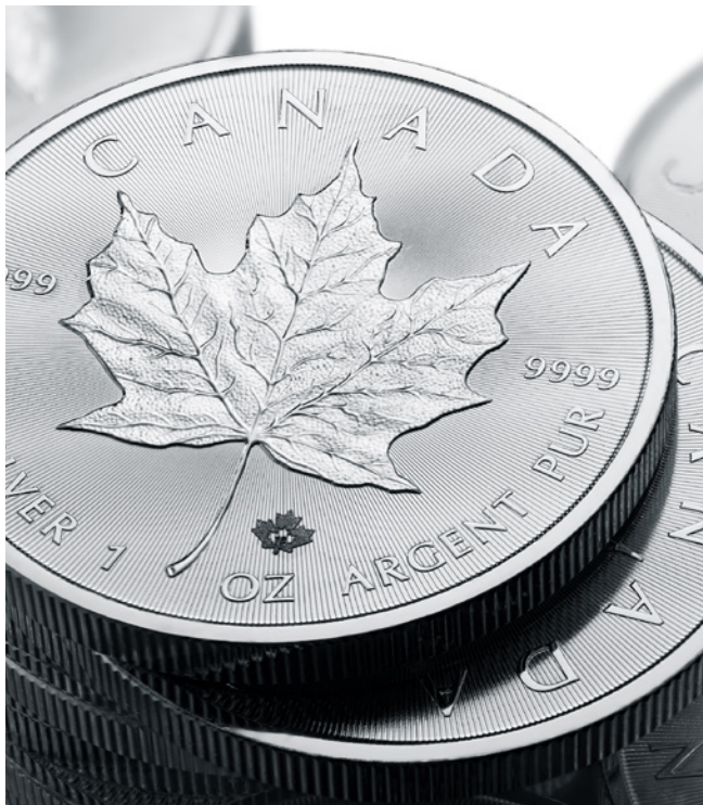
Pièces d'investissement Feuille d'érable en argent (FÉA)